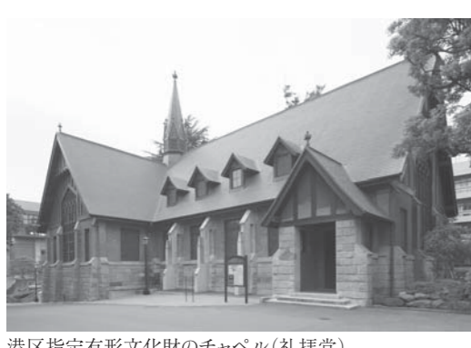
港区指定有形文化財のチャペル(礼拝堂)