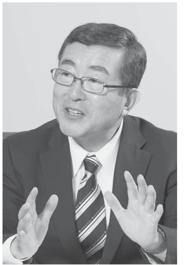
明治学院大学 大西晴樹学長

おおにし 晴樹 / 1953年北海道生まれ。法政大学法学部政治学科卒業。明治学院大学大学院政治経済研究科修士課程修了。専門はイギリス社会経済史、キリスト教史。2008年から現職。主な共著、編著に「マックス・ヴェーバーの新世界」(「帝国」化するイギリス)など。